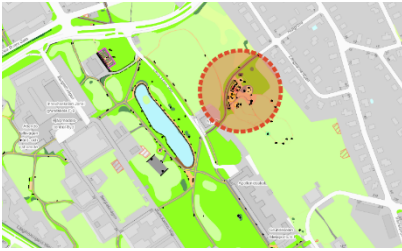
Lekplatsens placering i Långbroparken.

funktionsnedsättningar i form av speglar, ljudinslag och platser för avskildhet.